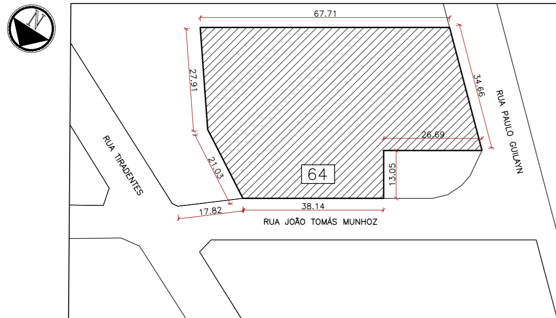
PLANTA DE SITUAÇÃO ESC. 1:1000